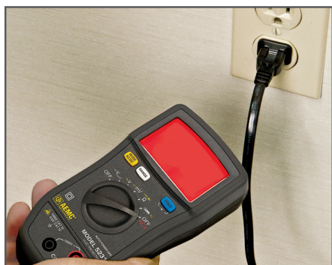
Detección de tensión de red sin contacto (función NCV, sólo para CA)