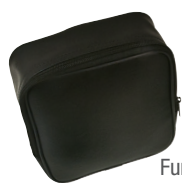
Funda del modelo 6610

Funda blanda de transporte, tres cables de prueba (negro/rojo/azul) de 1,22 m (4 pies), tres pinzas tipo cocodrilo (negras) y manual de usuario.