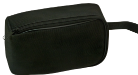
Funda de los modelos 6611 y 6612